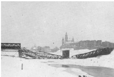
Most Dębnicki wysadzony przez Niemców