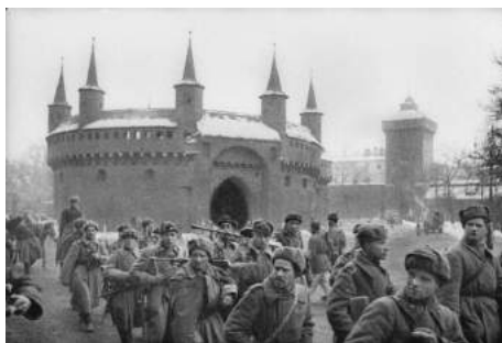
Żołnierze Armii Czerwonej przed krakowskim Barbakanem

Wkroczenie Armii Czerwonej przyniosło nie tylko upragnione przez lata odejście Niemców, ale także nową formę zagrożenia.